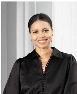
Lynn Hanong Geschäftsstelle